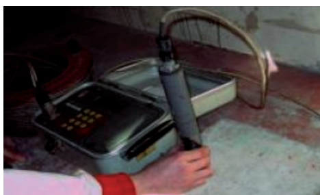
Appareil de mesure GECOR 06 (Cerema)

Une électrode placée à la surface du béton est raccordée à une armature. L'appareil calcule la résistivité du béton à partir de la résistance (obtenue par la chute ohmique à partir d'une impulsion entre l'électrode et le ferrailage) et du diamètre de l'électrode.