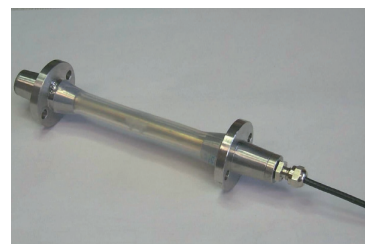
Corde vibrante sans raideur à excitation répartie (IFSTTAR)